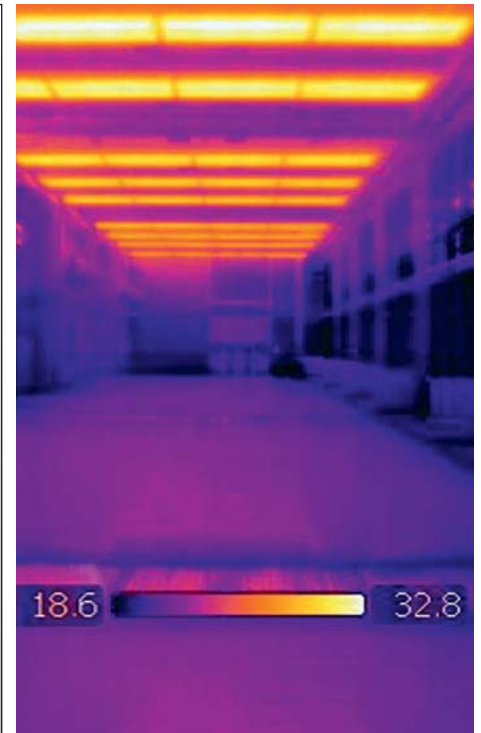
Die Wirkungsweise der Deckenstrahlheizung wird durch Wärmebildaufnahmen dokumentiert.

Die Vorgaben für neue bzw. grundlegend renovierte Gebäude sind hinsichtlich des Energieverbrauchs streng. Im Gesetz zur Förderung Erneuerbarer Energien im Wärmebereich EEWärmeG werden die Rahmenbedingungen abgesteckt. Grundsätzlich gilt: Je weniger geheizt werden muss, umso besser. Optimal gelingt dies mit einer effizienten, dichten Bauweise in Verbindung mit leistungsfähiger Haustechnik. Auf diese Weise sind dauerhaft geringe Betriebskosten sichergestellt. Bei Modernisierungsmaßnahmen liegen die Voraussetzungen naturgemäß anders. Im „Leitfaden für energieeffiziente Bildungsgebäude“, veröffentlicht im Juli 2010 vom Passivhaus Institut Darmstadt, wird das Thema ausführlich dargestellt. In der Einleitung heißt es: „Im Bereich der Bildungsgebäude besteht akuter Bau- und Modernisierungsbedarf. Mit einer Baumaßnahme wird heute der Energiebedarf für Raumheizung und Warmwasser für die nächsten 30 bis 40 Jahre festgelegt“. Unter dieser Prämisse kommt jeder Entscheidung, die den Energiebedarf beeinflusst, eine große Bedeutung zu. Selbst Details wirken sich gravierend aus; immerhin entfallen im Schnitt ca. 70 bis 80 % der Lebenszykluskosten auf die Zeit nach der Fertigstellung.