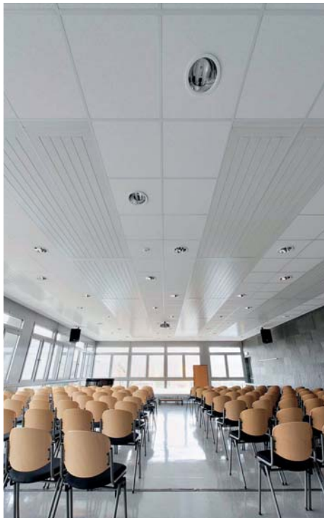
Deckenstrahlheizung in einer Aula – abgestimmt auf die Nutzungszeit wird eine schnelle Erwärmung garantiert.

Gute Lernbedingungen für die Schüler und eine günstige Ausgangsbasis für den Betrieb und die Unterhaltung der Schulgebäude – diese beiden Aspekte wollen bei einem Neubau oder einer Modernisierung wohl bedacht sein. Neben anderen Einflussfaktoren bestimmt auch die Wärmeverteilung die dauerhafte Effizienz. Hier können Deckenstrahlheizungen von Best einen guten Beitrag leisten.